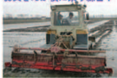
お父さんが横に乗り練習中

今年からトラクターが2台になったので息子が古い方を乗ってくれました。若いから飲み込みが早く頼もしいです。