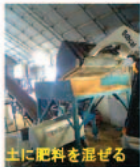
土に肥料を混ぜる

今年も田植えが無事に終わりました。 毎年同じ作業なので仕事の内容をどうお知らせしたらいいのか悩みましたが、今年も秋田のようすと私の仕事をお知らせします。